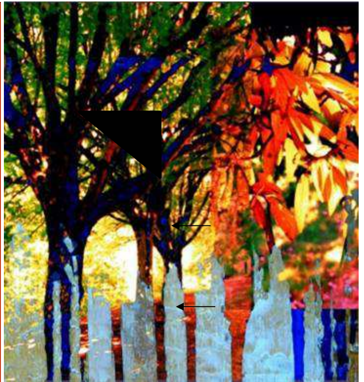
« Arbre », photo retouchée, concours Radiohead.fr 2011